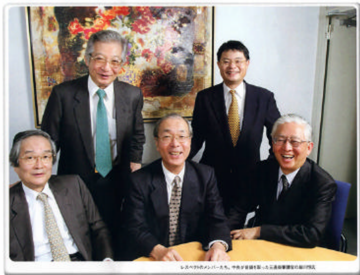
レスペクトのメンバーたち。中央が創業を助けた元通商産業省の副大臣