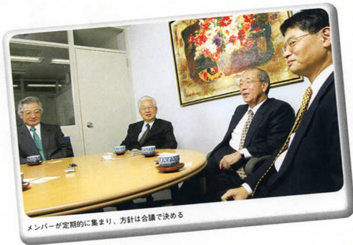
メンバーが定期的集まり、方針は合議で決める

事業性を意識したものとなる。共同作業で生まれた成果は、プロジェクトごとに、汗を流した量を考慮して損益配分をしておく方針だ。今より「現金な関係」になるものの、七人に共通しているのは、各個人ともLLPに収入を依存せず、収益優先に走らないこと。理念に合わない仕事は、引き受けない方針だ。